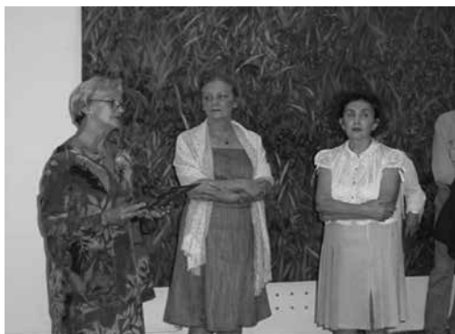
Слика 5 Отварање изложбе

су различити програми: тумачења аутора, разговори са уметницима и едукативне радионице. Тиме су изложбе поклон-збирки добиле исти третман као и све друге изложбе у ГМС.