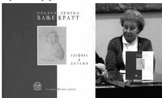
Слика 3 Каталог изложбе