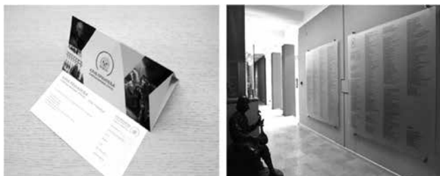
Слика 11 Флајера Клуба пријатеља и Табле пријатеља

Наш афирмативан однос према поклон-збиркама темељи се на уверењу да је у сваком друштву неопходно сачувати и подстицати традицију родољубиве филантропије, односно даровања уметничких дела и предмета националним установама културе. Чин даровања треба промовисати кроз делатност музеја као нешто позитивно, потребно и хвале вредно, што подстиче и друге да буду дародавци и добротинитељи у складу са својим могућностима. На тај начин ми, бавећи се основном музејском делатношћу – увећањем и представљањем уметничког фонда – заправо, пропaгирајући трајне вредности остварујемо позитиван утицај на друштво у коме делујемо.