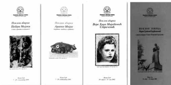
Слика 2 Каталог изложбе Поклон-збирки